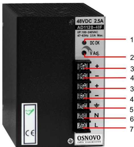
Рис.2 Блоки питания PS-48120/I, PS-48150/I, PS-48240/I, PS-48360/I внешний вид, разъемы и индикаторы